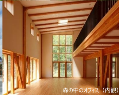
森の中のオフィス（内観）