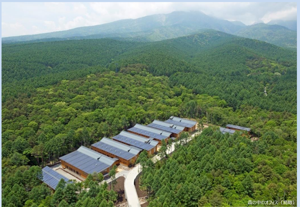
森の中のオフィス（鳥瞰）

2013年9月移転完了を厳守とするスケジュール管理を行った結果、2013年5月建物竣工、付帯工事を経て9月、東京原宿の本部を移転。供用開始を実現。