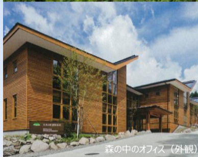
森の中のオフィス（外観）