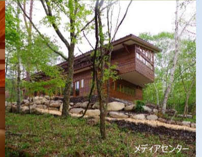
メディアセンター