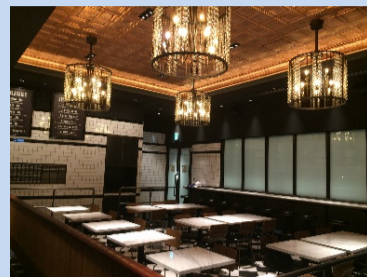
800°DEGREES NEAPOLITAN PIZZERIA (自社運営店舗)