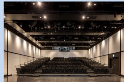
ルミネゼロ (多目的ホール)