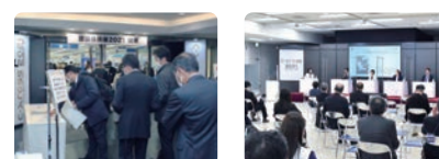
建設技術展2021 関東の様子