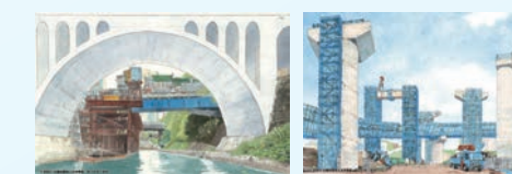
モリナガ・ヨウの土木展

※聖橋/御茶ノ水駅改良工事(土木学会誌2021年5月号表紙)=左 ※横浜環状南線・横浜湘南道路 栄IC-JCT工事(土木学会誌2021年1月号表紙)=右