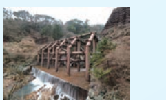
第13回土木写真部写真展 NO DOBOKU, NO LIFE. 土木技術者による土木構造物だけの写真展