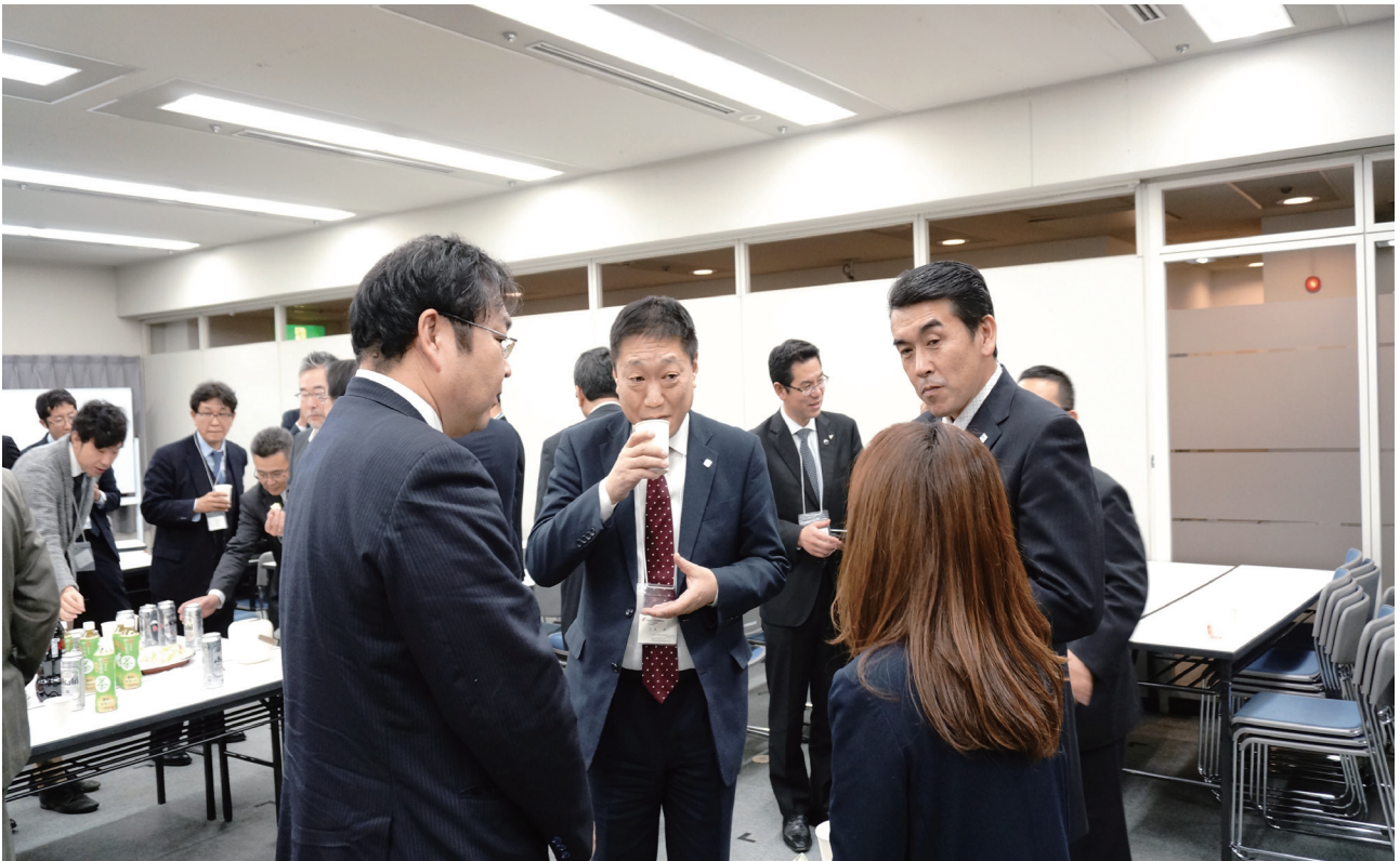
■情報交換会の様子（2）