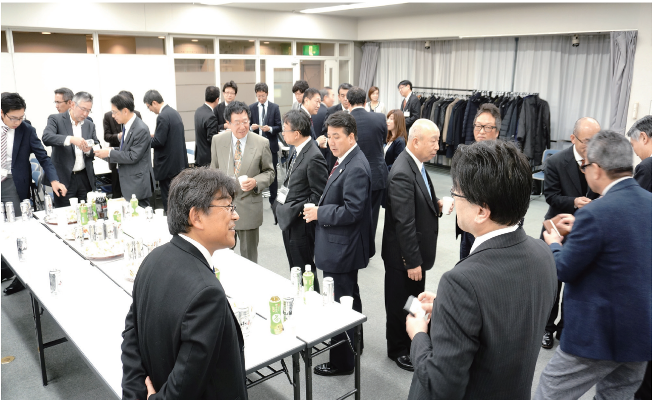
■情報交換会の様子 (1)