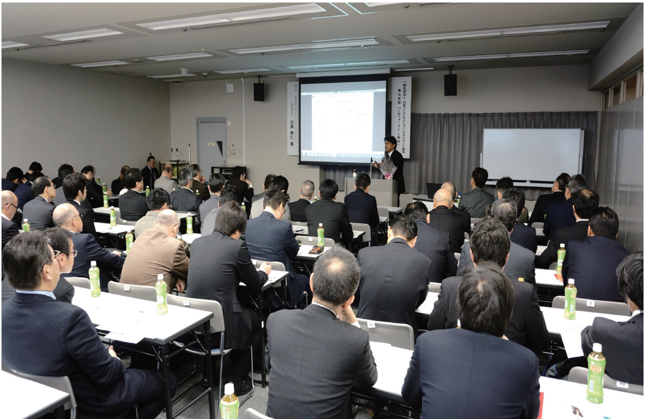
■講演中の様子（78名の参加がありました）