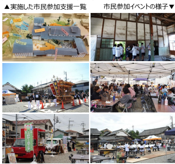
▲実施した市民参加支援一覧 市民参加イベントの様子▼