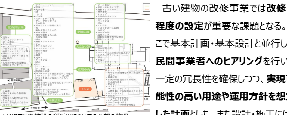
▲WSで出た施設の利活用についての要望の整理