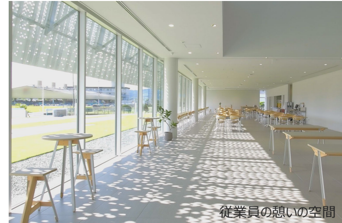
従業員の憩いの空間