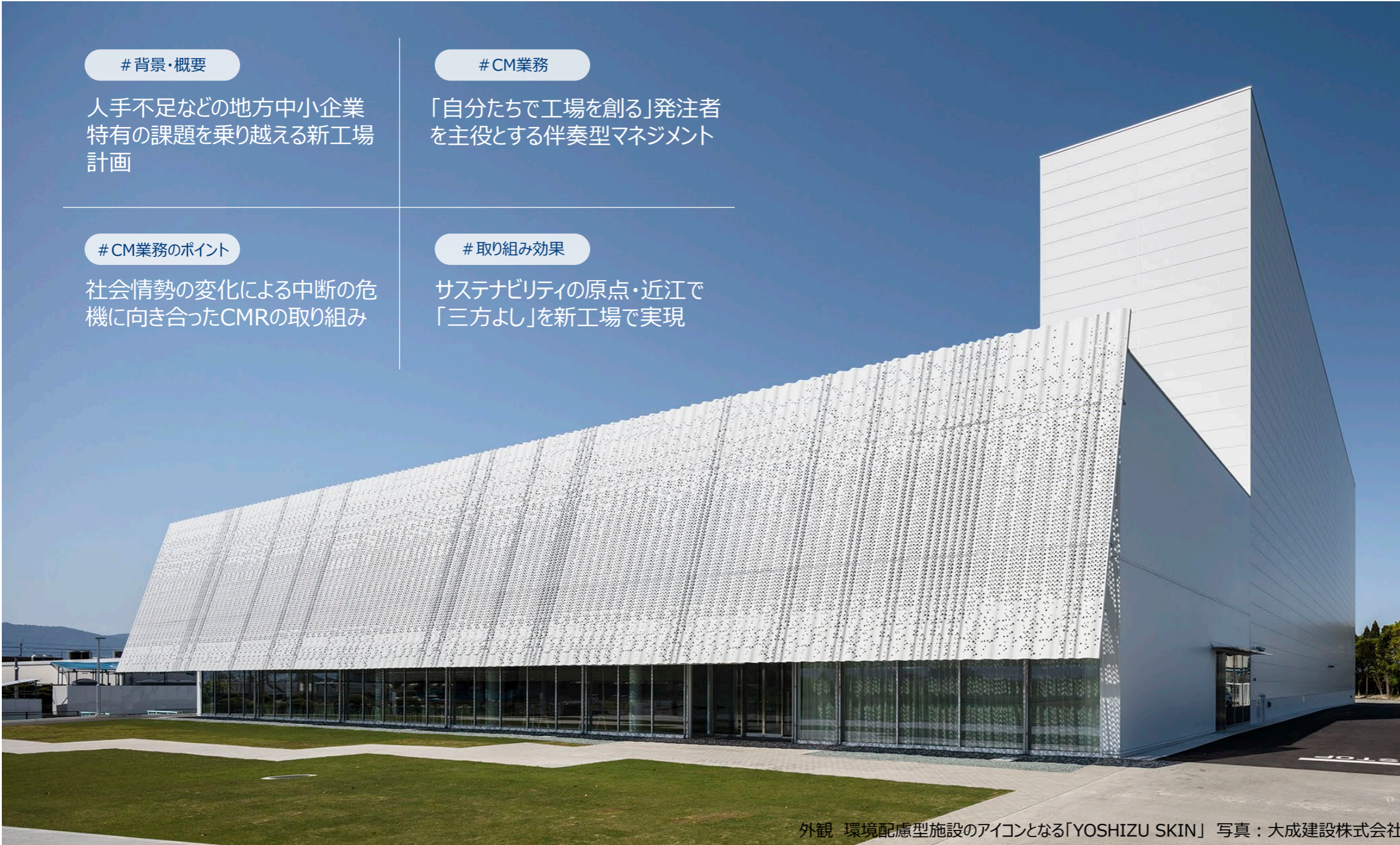
外観 環境配慮型施設のアイコンとなる「YOSHIZU SKIN」

地方中小企業における三方よしを体現する高効率・高品質・環境配慮の新工場建設プロジェクト