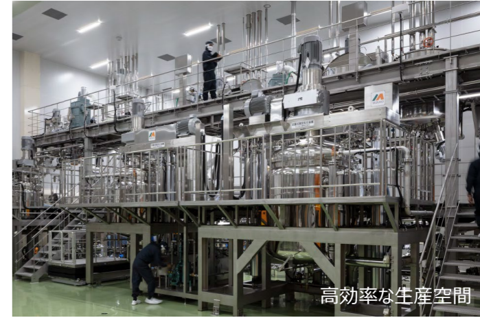
高効率な生産空間