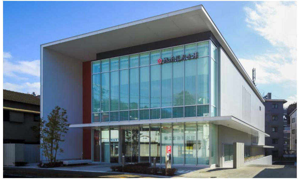
北側前面道路から見る、「絹」をイメージさせるファサード