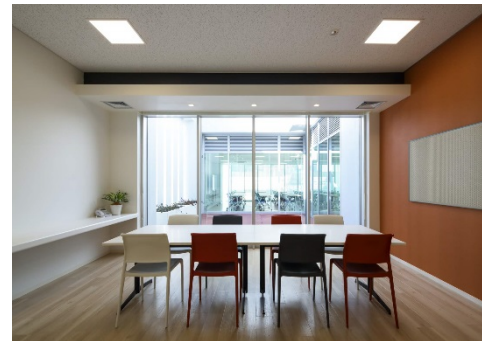
光庭に面した明るい2階食堂