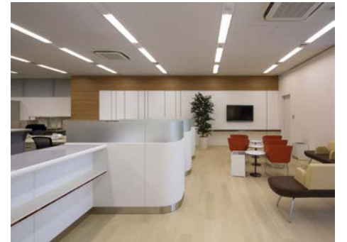
清潔感と開放性を併せ持つ1階ロビー